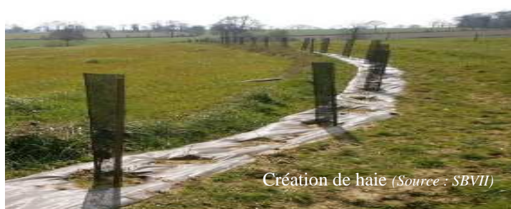
Création de haie

→ La mobilisation du programme Breizh Bocage sur le territoire a pour but l'amélioration de la qualité de l'eau en limitant le ruissellement et l'érosion. Cet accompagnement vise donc surtout des projets bocagers en bords de parcelles agricoles et en rupture de pente.